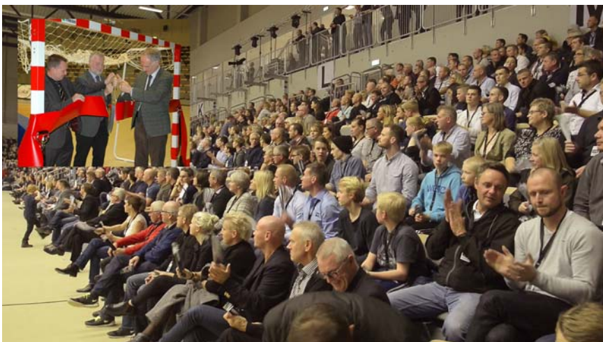
Den nye arena i Næstved, som er tiltænkt en del af NK-Forsynings formue, var stopfyldt med tilskuere allerede få timer efter, at Bertel Haarder klippede snoren.