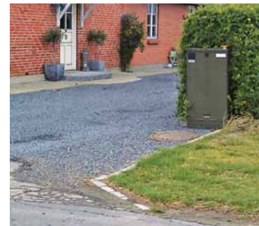
Placering af pumpebrønd og styreskab i forbindelse med indkørsel.

Kommer der til at ligge en spildevandsledning eller brønd på din ejendom, skal der indgås aftale mellem dig og Forsyningen om placering af ledningsanlæggene og erstatningens størrelse. Det kan enten ske ved en frivillig aftale eller ved ekspropriation. Du modtager nærmere information om dette senere.