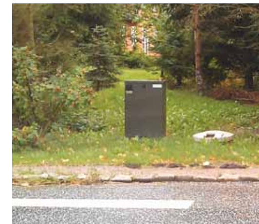
Styreskab og pumpebrønd placeret ud til kørefast vej.