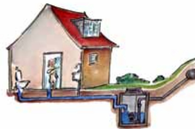
Eksempel på pumpebrønd

Anlæg til at pumpe afløbsvand væk. Anlægget består normalt af en eller flere pumper anbragt i en opsamlingsbeholder eller brønd.